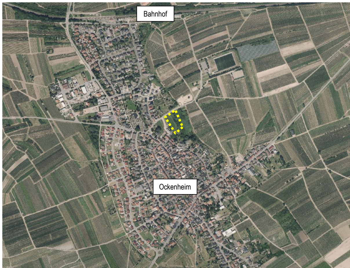
Abbildung 1: Orthofoto mit Abgrenzung des Geltungsbereichs Abbildung unmaßstäblich, die Daten/Karten/Produkte wurden unter Verwendung der amtlichen Geofachdaten des Landschaftsinformationssystems Rheinland-Pfalz erzeugt. Sie unterliegen der Open Database Lizenz.)

Die Ortsgemeinde Ockenheim (Verbandsgemeinde Gau-Algesheim, Kreis Mainz-Bingen) beabsichtigt am Sporkenheimer Weg (Gewann „Im Woog“) am Ostrand der Ortslage von Ockenheim die Aufstellung eines Bebauungsplans zur planungsrechtlichen Sicherung eines Standortes für einen neuen kommunalen Kindergarten. Der Geltungsbereich weist eine Größe von ca. 0,6 ha auf. Die Lage im Ortsgebiet ist Gegenstand der nachstehenden Abbildung.