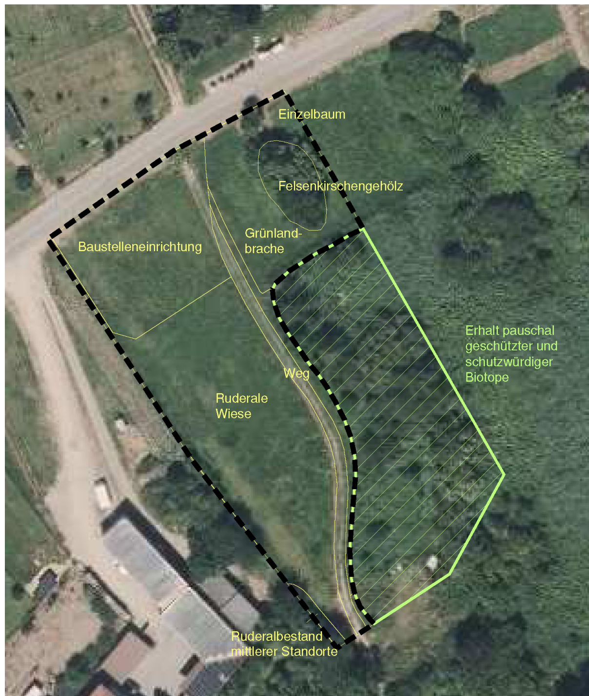
Abbildung 2: Eingriffe innerhalb der Fläche für den Gemeinbedarf (schwarze Strichlinie) und Maßnahmen zur Vermeidung von Eingriffen auf das Schutzgut Pflanzen (Abbildung unmaßstäblich, die Daten / Karten / Produkte wurden unter Verwendung der amtlichen Geofachdaten des Landschaftsinformationssystems Rheinland-Pfalz erzeugt. Sie unterliegen der Open Database Lizenz.)

pen, so dass diese in der Eingriffsbilanz unberücksichtigt bleiben können (siehe nachstehende Abbildung).