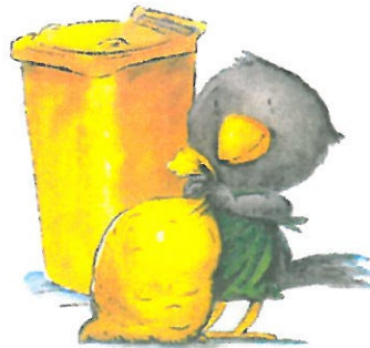
Gelbe Tonne / Gelber Sack