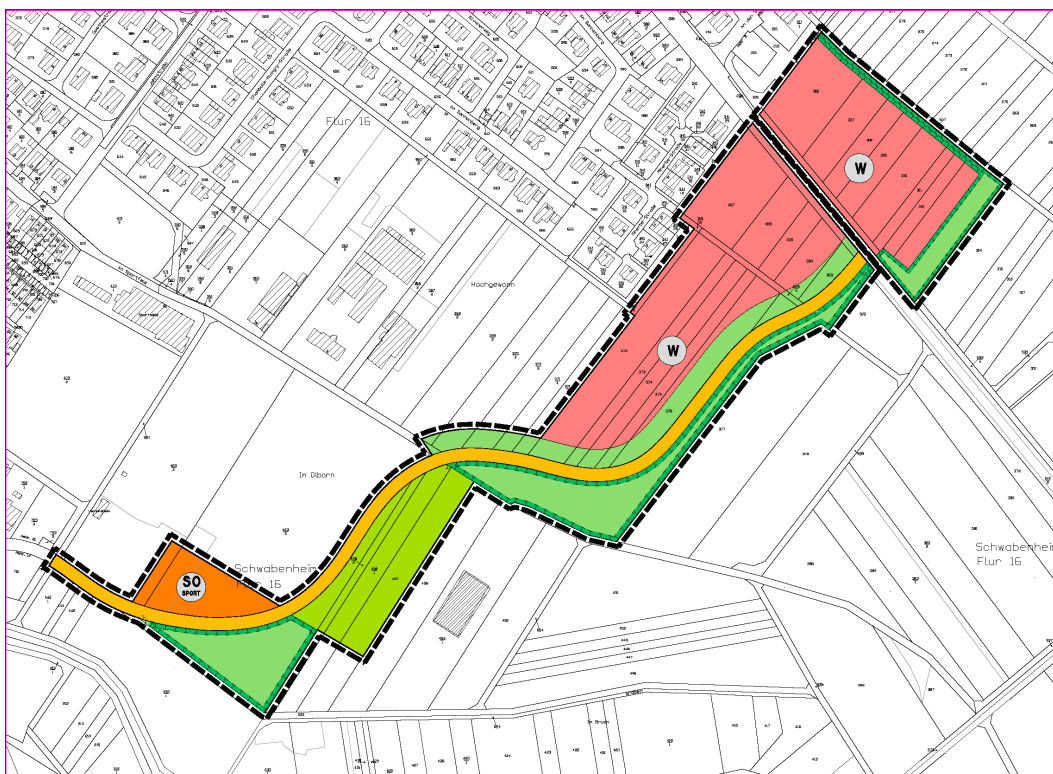
Abb. 1: Vorentwurf der 22. Fortschreibung des Flächennutzungsplans in der Fassung für die frühzeitige Unterrichtung der Öffentlichkeit, Behörden und sonstigen Träger öffentlicher Belange (Abbildung unmaßstäblich)