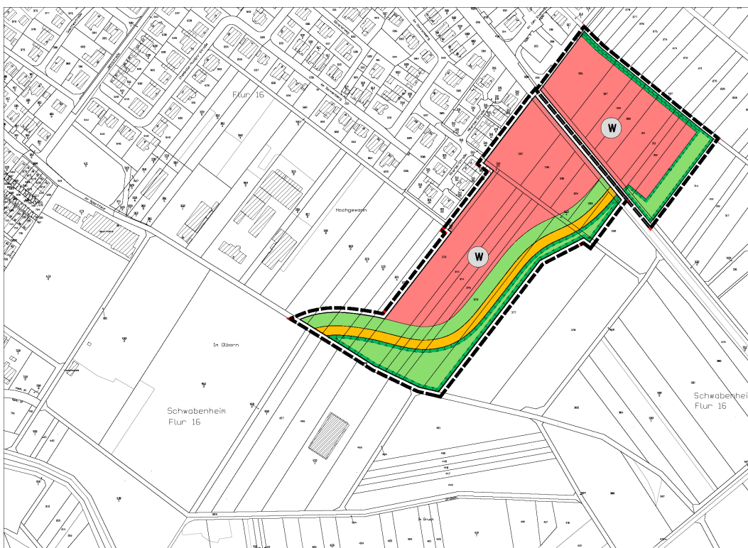
Abb. 2: Entwurf der 22. Fortschreibung des Flächennutzungsplans in der Fassung für die Offenlage (Abbildung unmaßstäblich)